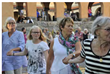
Festkväll, Sommarmötet 2015