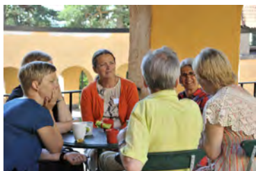
Samtal i fikapaus, Sommarmötet 2015

Barn och ungdomar välkomnas varmt till sommarmötet. Vi ordnar ett speciellt program för dem under förmiddagarna. Alla under 18 år deltar i sommarmötet utan kostnad.